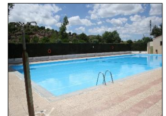
Piscina (sólo en verano)