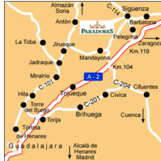
Mapa de carreteras Sigüenza