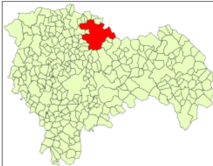
Situación de Sigüenza en Guadalajara