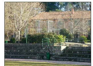
Pequeño anfiteatro o grada