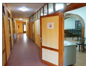
Pasillo de la planta baja del albergue