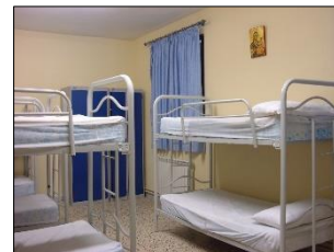
Habitación del albergue