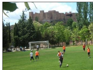
Campos de deportes