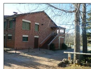
Entrada principal al albergue