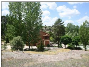
Zona de juegos

El albergue es una instalación moderna de 800 m 2 , recién remodelada. Consta de ocho dormitorios con 69 plazas, aseos, duchas, cocina, almacén de menaje, sala de enfermería y botiquín, y comedor. Toda la instalación dispone de calefacción día y noche, y de agua caliente. La zona recreativa dispone de un campo de hierba de fútbol 11, dos campos de fútbol sala, dos de baloncesto, dos frontones, una pista de tenis, dos rocódromos y un campo de voleibol. Todo ello en un entorno de frondosa arboleda en la cual se encuentra un parque infantil.