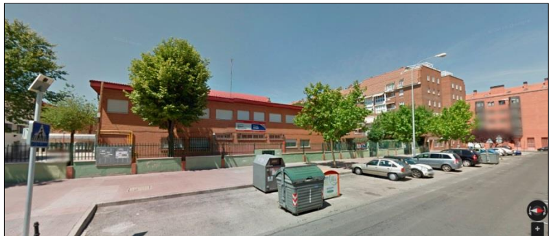
Calle Luis Madrona 15, en donde nos recogerá y dejará al autobús