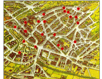
Plano de Sigüenza