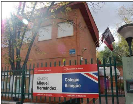
Puerta delantera del CEIP Miguel Hernández

*. Ubicación del CEIP Miguel Hernández, Cl. Luis Madrona 15. Coord. GPS 40.490917, -3.350466.