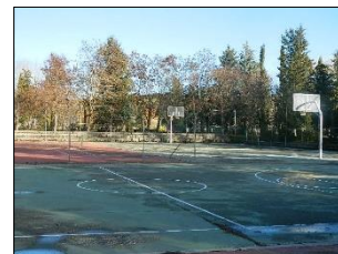
Campos de deportes