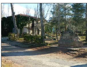
Fuente de agua potable